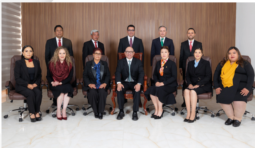
AYUNTAMIENTO CONSTITUCIONAL DE ZINACANTEPEC 2025-2027