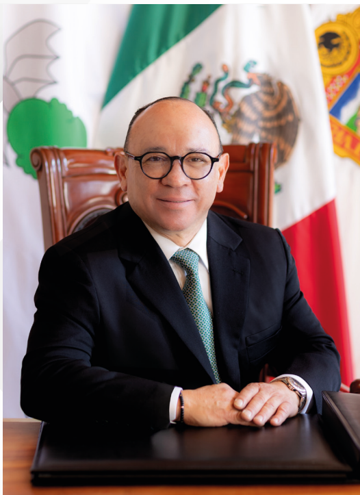
LIC. MANUEL VILCHIS VIVEROS PRESIDENTE MUNICIPAL CONSTITUCIONAL DE ZINACANTEPEC