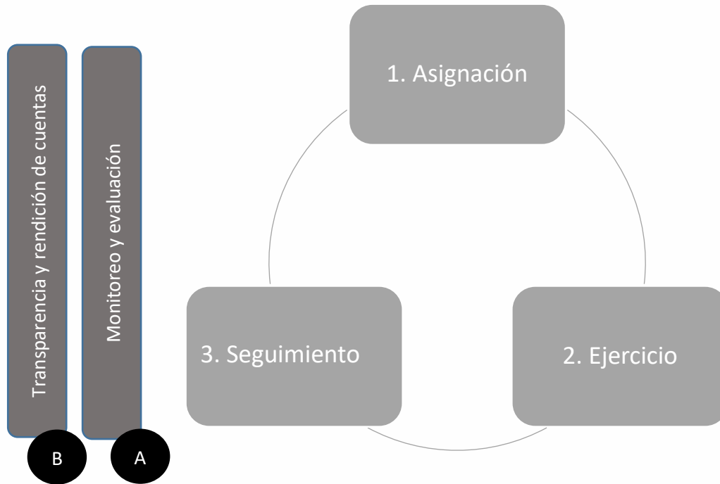
Tabla general del proceso