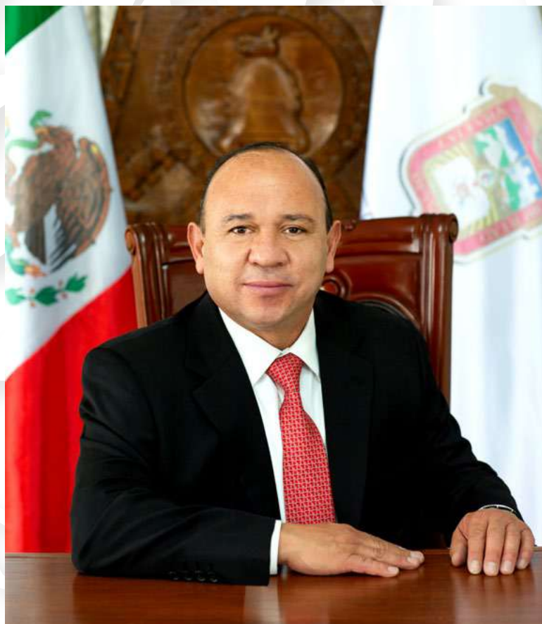
LIC. MANUEL VILCHIS VIVEROS PRESIDENTE MUNICIPAL CONSTITUCIONAL DE ZINACANTEPEC